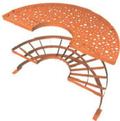
Deska pro nalepení DZ